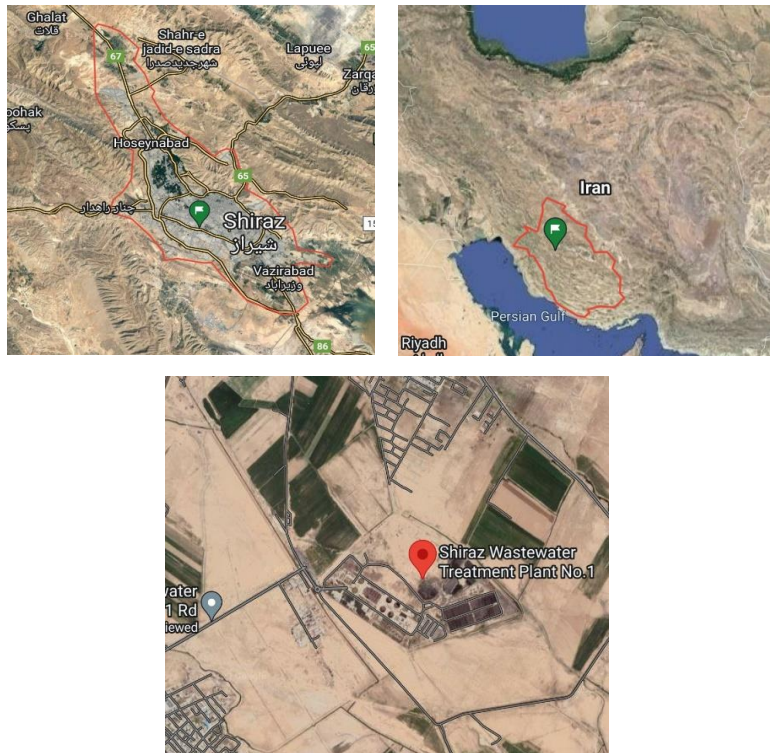
شکل ۱- نقشه موقعیت جغرافیایی منطقه مورد مطالعه

ته‌نشيني اوليه، سلکتور، حوضچه هوادهى، حوضچه ته‌نشيني ثانويه و واحد کلرزنى مى‌باشد (Jahed et al., 2013). در اين پژوهش براى محاسبه شاخص‌هاى